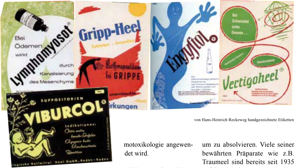
von Hans-Heinrich Reckeweg handgezeichnete Etiketten

schaffler arbeiten und sich nicht mit den Einschränkungen durch die Bürokratie auseinandersetzen. Die Unternehmensgruppe wurde an den Quandt-Konzern verkauft.